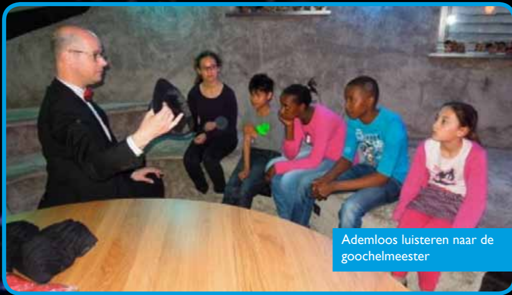
Ademloos luisteren naar de goochelmeester