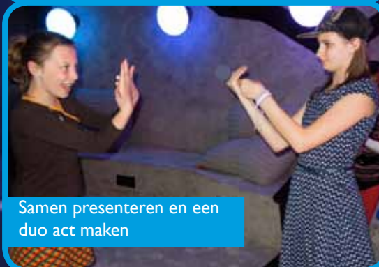
Samen presenteren en een duo act maken