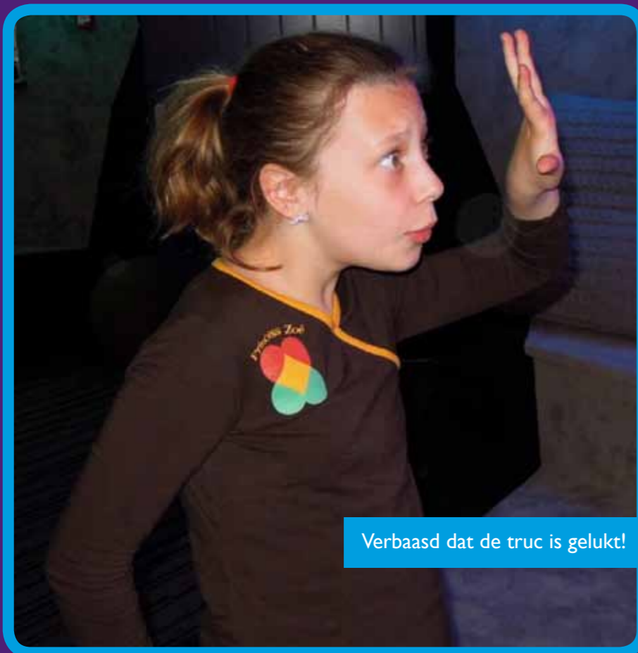
Verbaasd dat de truc is gelukt!