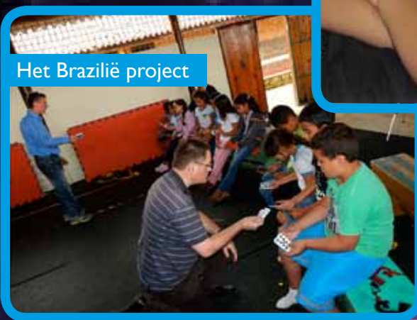
Het Brazilië project